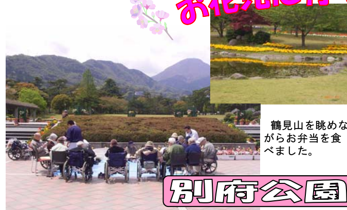
鶴見山を眺めながらお弁当を食べました。