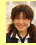
平川介護支援専門員