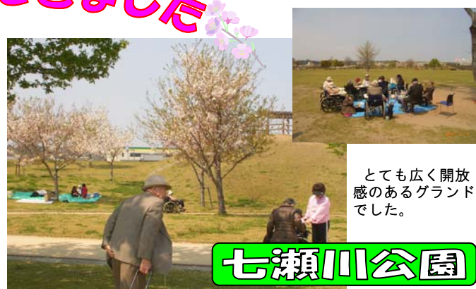
とても広く開放感のあるグラウンドでした。