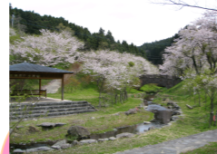
約1時間半の時間をかけてのドライブでしたが、皆様雄大な景色を見られ大変感動されておりました。三連水車の前でお花見弁当を広げました。