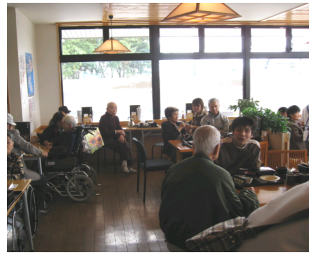
これが名物『太刀重』です。写真はお粥食の御入居者用に対応していただいたものです。