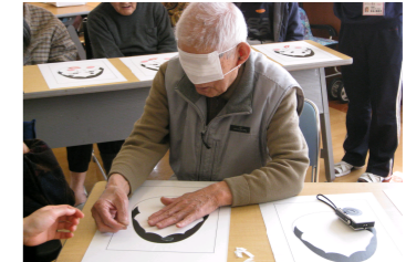
実際に福笑をされている様子です。なかなかうまくいかず苦戦される御入居者の方には職員が個別に声かけしお手伝いしました。

2月は屋外の気候も厳しいこともあり、多目的ホールにて『福笑』と『風船バレー』を実施しました。『福笑』では御入居者一人ひとりに準備された福笑(職員の手作り)に皆様挑戦して頂きました。目隠しをした状態で、顔のパーツをおいていく作業に皆様、悪戦苦闘されていましたが無事に?! 作品を完成されました。後半のレクとして行った風船バレーでは各フロア対抗で対戦を行い大変盛り上がりました。勝敗に関係なく皆さん風船を思いっきりアタックされていました!!