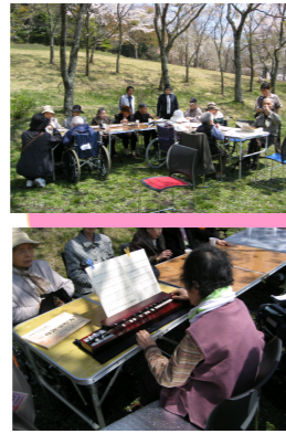
御入居者が大正琴を弾いてくださいました。桜の花が舞い散る中それに合わせて皆さんで春の歌を歌いました。