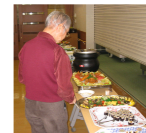
＜バイキングメニュー＞ *写真はメニューの一例です。