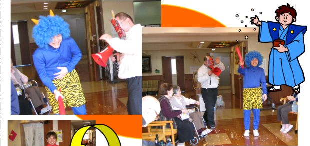
豆まき終了後の鬼さんの様子。お疲れ様でした。(笑)

2月1日に節分行事として豆まきを行いました。職員が赤鬼と青鬼にふん装し各フロアを回り、御入居者に豆をぶつけて?! もらい邪気を払い、福を呼んでもらい、年の数だけお豆をいただきました。お正月を迎えカレンダー上では新年を迎えましたが、暦の上ではこの節分を年変わりの日と考えるそうです。