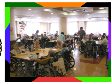
皆様好きなメニューを選んでいただき、テーブルを囲んで楽しく召し上がっていただきました。