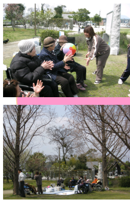
皆さんでお弁当を食べたあと食後の運動として2チームに別れ『ボール送り』を行いました。大変白熱しました!!(笑)