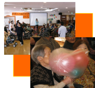
風船バレーのご様子です。職員も中に入り一緒に良い汗をかかせていただきました。