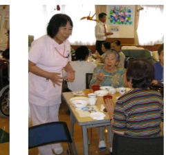
* 御入居者81名の方にご参加いただきました。