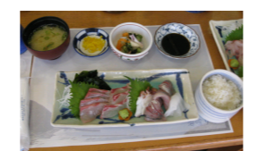
[海鳴り定食(お刺し身)]

7月は高速道路が佐伯市まで開通したこともあり、かまえ道の駅「海鳴り亭」さんへお刺身を食前に皆さんでお出かけしました!! さすがに取れたての新鮮な魚ばかりで、参加された皆さんとても美味しいといわれ、大好評でした。「海鳴り亭」の職員の方には忙しい時間帯にもかかわらずとても丁寧に対応頂きありがとうございました。暑い時期の外出行事でしたが帰りにきれいな海も見ることが出来、無事に終わることが出来ました。