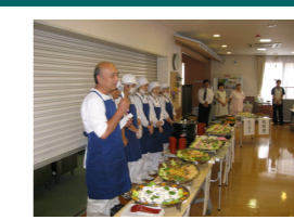
[森永食研(厨房)職員挨拶]