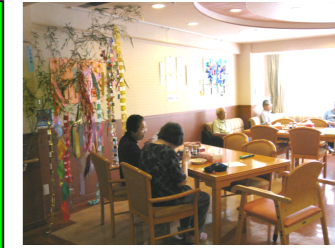
* 当日希望された御入居者の方にご参加いただきました。