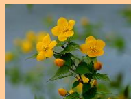
「やまぶきの花」 グローバルライフ生石にて

やまぶきは、春に咲く可憐な花です。花言葉は、「崇高」、気品が高いです。私達は、入居された方々のライフバシーや尊厳を大切に生活をサポートしていきます。やまぶきを通じて皆様の活々とした暮らし、山吹色に輝く笑顔をお伝えします。