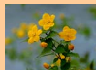
「やまぶきの花」 グローバルライフ生石にて

「やまぶきは、春に咲く可憐な花です。花言葉は、「崇高」、「気品が高い」です。私達は、入居された方々のプライベートや尊厳を大切に生活をサポートしていきます。「やまぶき」を通じて皆様の活々とした暮らし、山吹色に輝く笑顔をお伝えします。