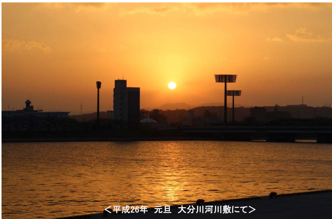
＜平成26年 元旦 大分川河川敷にて＞