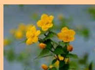
「やまぶきの花」 グローバルライフ生石にて

「やまぶき」は、春に咲く可憐な花です。花言葉は、「崇高」、「気品が高い」です。私達は、入居された方々のプライベートや尊厳を大切に生活をサポートしていきます。「やまぶき」を通じて皆様の活々とした暮らし、山吹色に輝く笑顔をお伝えします。