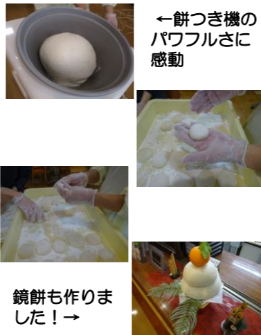
←餅つき機の パワフルさに 感動

大分県内でのコロナ感染者急増を受け、今年は皆さんで行うもちつき行事はやむを得ず中止とさせて頂きました。腕まくりをして、張り切っていた方も多かったですが、その元気は来年にとっておいてもらい、代わりに餅つき機が頑張って、餅を搗き、職員がなんとか餅を丸め、ぜんざいにして皆さんに召し上がって頂きました。 2022年最後の行事だったので、なんとか出来ないかと模索しましたが、残念でした。