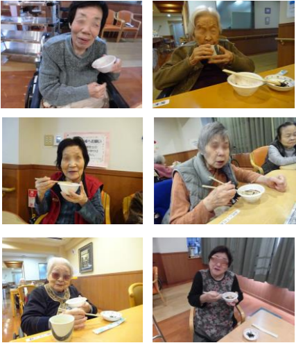
鏡餅も作り ました！→

ウィズコロナの時代になったとはいえ、施設内での生活は変わらずです。感染予防対策を行いながら、規模を縮小したり、緩めたりしながらレクリエーションを行っています。少しでも気分転換ができ、笑顔で過ごす時間が増えることを目標に取り組んでいます。